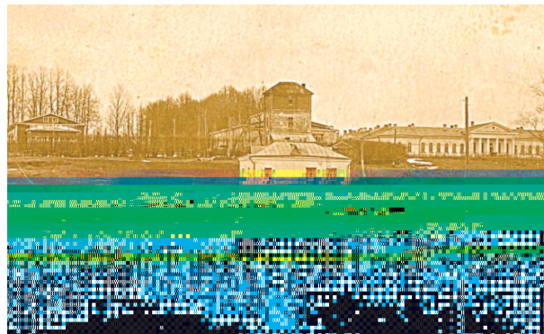
Усадьба Бахтимерево-Милославское. Фото 1961 г.